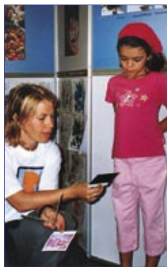
« Aujourd'hui, on mange des champignons » : les enfants ont pu emporter chez eux les photos polaroid dans la petite sacoche Champignons suisses.