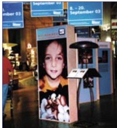
Exposition d'information sur le thème des champignons : la production de champignons et d'autres facettes de tous les domaines de ces étonnantes merveilles de la nature.

Du 8 au 20 septembre, l'USP et Champignons Zürcher AG étaient invités au Shoppyland de Schönbühl dans le cadre d'une promotion de champignons. Les clients ont pu découvrir des informations intéressantes sur la culture de champignons de la production suisse et d'autres facettes du monde merveilleux des champignons. Au cours de ces deux semaines, l'attraction principale du « Shoppy » tournait autour du champignon : dans les restaurants, on proposait des menus de champignons et les enfants recevaient un coloriage qui pouvait être échangé contre un porte-clef avec un champignon en peluche. Aussi bien l'action photo polaroid, la dégustation, le tirage au sort que l'exposition de champignons sauvages ont suscité une vive affluence.