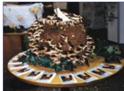
Particulièrement surprenant : les cultures de shii-takes (photo), pleurotes et champignons de Paris.