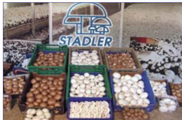
L'assortiment de champignons de « Culture de champignons Stadler »

Cédric Stadler : nous fournissons dans toute la Suisse Romande les supermarchés, les grossistes, les primeurs et les restaurants des environs.